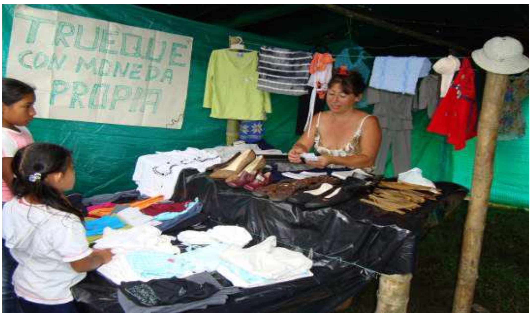
CONGRESO DE TACUEYO DEL 23 AL 28 DE FEBRERO DE 2009