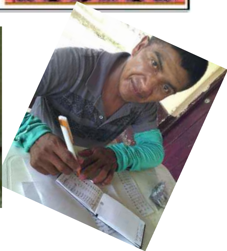
AÑO 2017 PEDAGOGÍA COMUNITARIA "COMERCIO ESCUELA LA ESPERANZA"